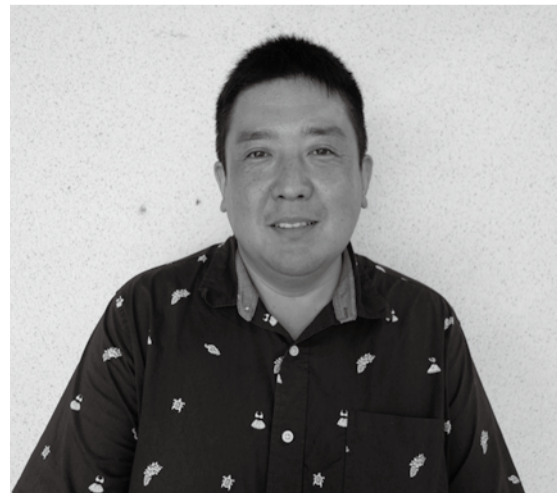
老後とダイエットが気になると親しみやすい人柄いっぱいです。

を忘れずに」と、心がけているそうです。10年継続している趣味の釣りも、多世代の方や家族と楽しまれ、充実した日々を過ごしています。中学校PTA会長も務め、子どもが卒業後も先生と親交されています。コロナの影響で、地域に活気が無くなったと、心を痛め、地域の方が活気を取り戻してくれたらと、明るく元気に地域の方との繋がりを、大切にされています。お互いに手助けしながら距離を縮め、地域に活気戻ることを願っています。とお話してくださいました。