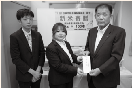
障がい者施設や食事サービスボランティア団体などにご提供させていただきました。