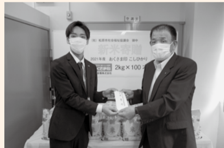
障がい者施設や食事サービスボランティア団体などにご提供させていただきました。