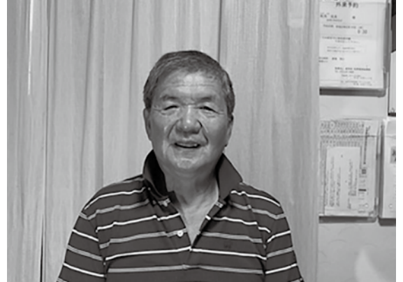
人を想う気持ちや行動力により、周りからの信頼も厚い松永さん。